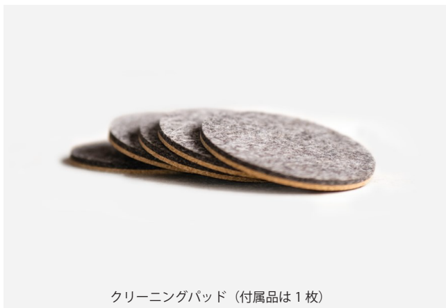
クリーニングパッド (付属品は1枚)

カラー : ウォールナット サイズ : 12.5 x 4.4 x 4.4cm 重さ : 166g